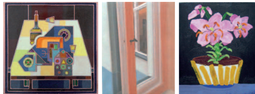
Hackemann, Stillleben, 2011 Haiss, Ohne Titel, 2010 Kroos, Topfblume II, 2004

Die aktuelle Ausstellung greift nun die Frage auf: „Inwiefern haben sich die Malerei, Motive und Methoden seither verändert?“ Ein hin und wieder vermutetes Ende der Landschaftsmalerei ist nicht in Sicht. Vielmehr zählt die Hinwendung zur Natur und Landschaft heute noch zu den fundamentalen Pfeilern der Kunst, die in der Malerei die uns umgebende Welt immer wieder neu erfindet.