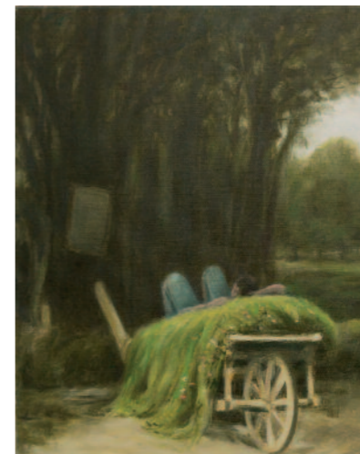
Ohne Titel, 2011