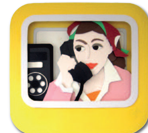
Ruf doch mal an, 2008

2011 Extrem süß gemalt, gehäkelt, gegossen, Staatliche Kunsthalle Karlsruhe | Brett vorm Kopf/Holzbilder, Kunstverein Xanten* | Beauty within the banal, Galerie Muratcentoventidue, Bari, Italien* | Dach überm Kopf, Galerie Tedden, Düsseldorf* | 2010 ART KARLSRUHE und ART.FAIR 21 Köln, Galerie Tedden | 2009 libro degli ospiti – vista su lago, Porto Ceresio, Italien* | Ritter, Malkasten Düsseldorf | blind date, Kunstverein Radolfzell, Villa Bosch* | Bella Donna, Galerie Tedden, Düsseldorf* | 2008 KUNSTART, Bozen, Italien, Galerie Tedden | 2007 ART KARLSRUHE – One Artist Show Galerie ABTart, Stuttgart* | Pentiment, Fabrik der Künste, Hamburg | Kennzeichen D, Sammlung Tedden, Galerie der Stadt Remscheid* | 2006 shilling shocker, Galerie Tedden, Düsseldorf* | Die Jägerprüfung, Galerie Tedden, Oberhausen * | Der gedeckte Tisch, Galerie Netuschil, Darmstadt | Verstehen braucht Kontext II, Malkasten Düsseldorf | 2005 arrabiata, ZF Kulturstiftung, Zeppelin Museum, Friedrichshafen* | daheim, Kronberger Kulturkreis, Museum Kronberger Malerkolonie* | paint it loud, Galerie Tedden, Oberhausen* | VIENNA ARTFAIR, Wien und ART FRANKFURT, Galerie Tedden | * Einzelausstellung | K Katalog