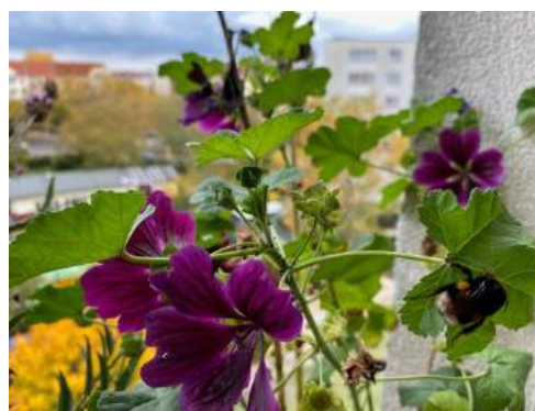
Malve mit Hummelkönigin