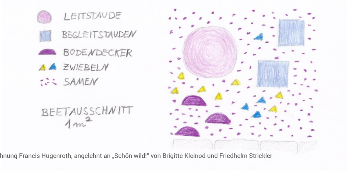
Zeichnung Francis Hugenothe, angelehnt an „Schön wild!“ von Brigitte Kleinod und Friedhelm Strickler

Zeichnen Sie auf, wie Sie die Leitstauden, Begleitstauden und weiteren Pflanzen ungefähr im Beet verteilen möchten. Beim Pflanzen legen Sie die Stauden in den Töpfen auf der Fläche aus und beginnen mit den Leitstauden. Nach den Begleitstauden und Bodendeckern stecken Sie die Blumenzwiebeln zwischen die Stauden. Als letztes säen Sie die Samen in die Lücken. Hier ein Beispiel für einen Pflanzplan.